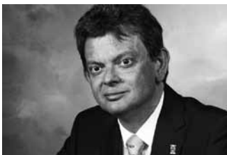
Anton Muscatelli