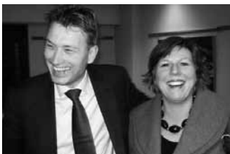
Halbe Zijlstra und Marja van Bijsterveldt