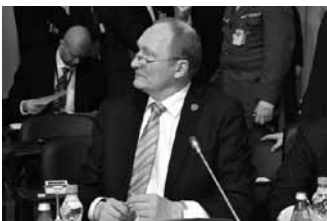
Jaak Aaviksoo

Pressemitteilung von Bosch, 17.05.2011 (auf Englisch) bosch-presse.de/